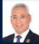
أ.د/ عصام الدين صادق فرحات رئيس الجامعة