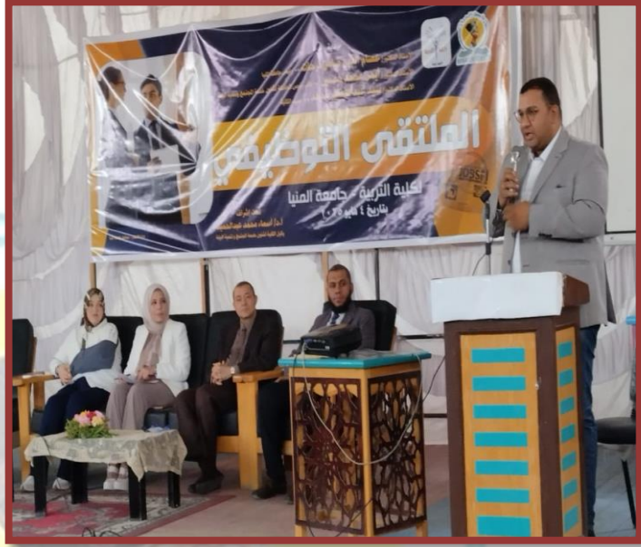
مدرسة رجاك خلال الكلمة حول مواصفات الخريج

جامعة المنيا - كلية التربية - وحدة ضمان الجودة