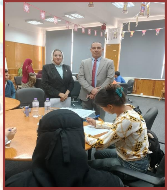
مدرسة الفيوتشر خلال اجراء مقابلات التوظيف