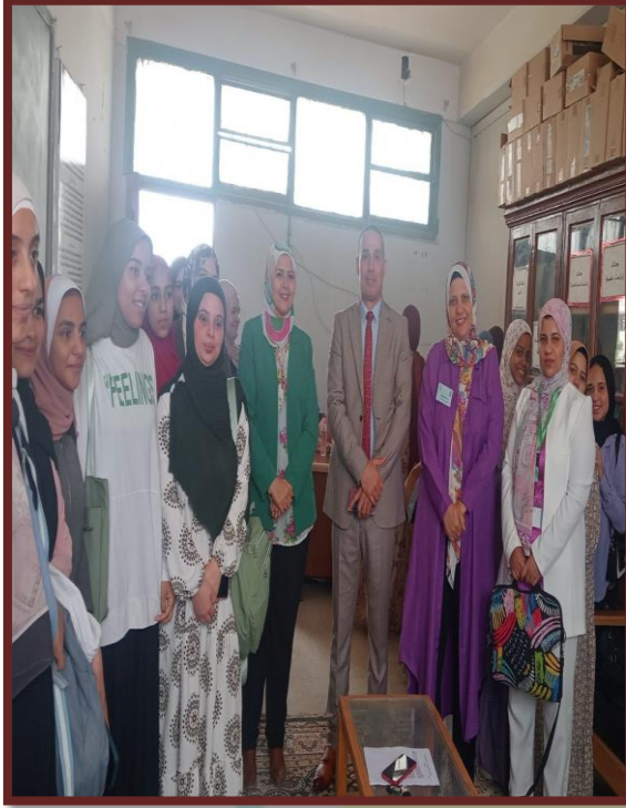
مركز الوفاء لرعاية ذوي الاحتياجات الخاصة خلال مقابلات التوظيف