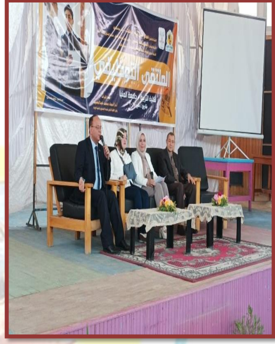
مدير مدارس النيل الدولية خلال كلمته حول مواصفات الخريج