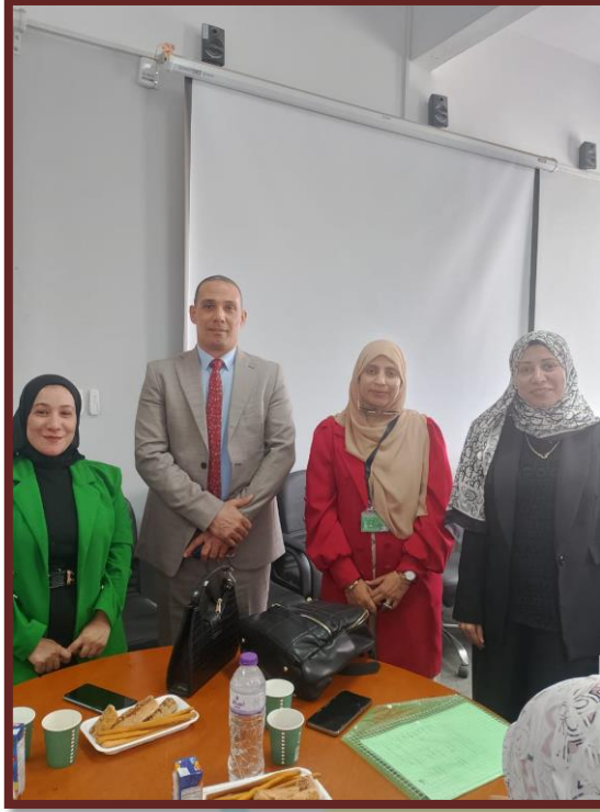
فريق مدرسة رواد المستقبل خلال مقابلات التوظيف