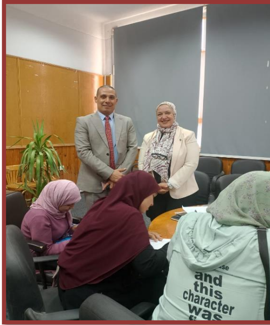
مدرسة رجاك خلال اجراء مقابلات التوظيف

اجرى اصحاب الاعمال من (رؤساء مجالس الادارات ومديري المدارس الخاصة ومديري مراكز رعاية ذوي الاحتياجات الخاصة) مقابلات شخصية بغرض التوظيف مع خريجي الكلية وطلاب الفرقة الرابعة وقد اتاحت المدرسة المصرية اليابانية رابط لتسجيل للراغبين في التوظيف بها .