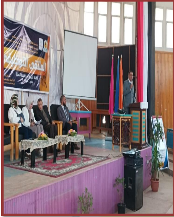
رئيس مجلس ادارة المدرسة البريطانية خلال كلمته حول مواصفات الخريج