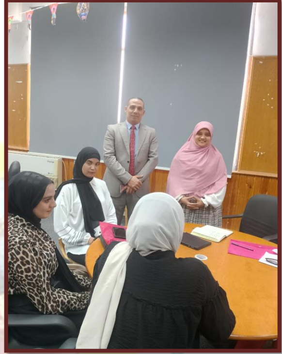
مدرسة المنارة خلال اجراء مقابلات التوظيف