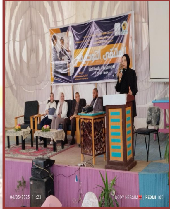
مدرسة الفيوتشر خلال الكلمة حول مواصفات الخريج