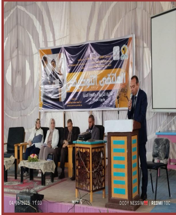
رئيس مجلس ادارة مدرسة ستارز خلال كلمته حول مواصفات الخريج