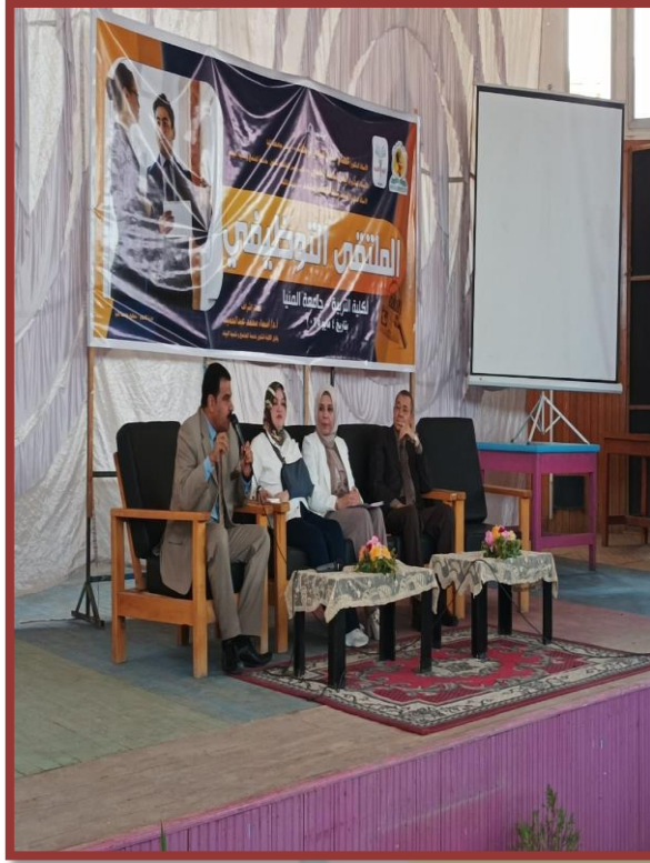
المدرسة المصرية اليابانية خلال كلمته حول مواصفات الخريج