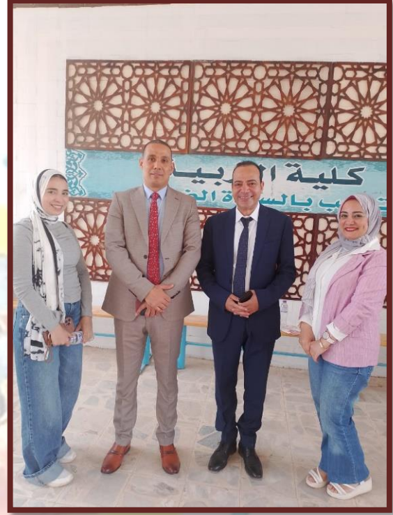
فريق مدرسة ستارز